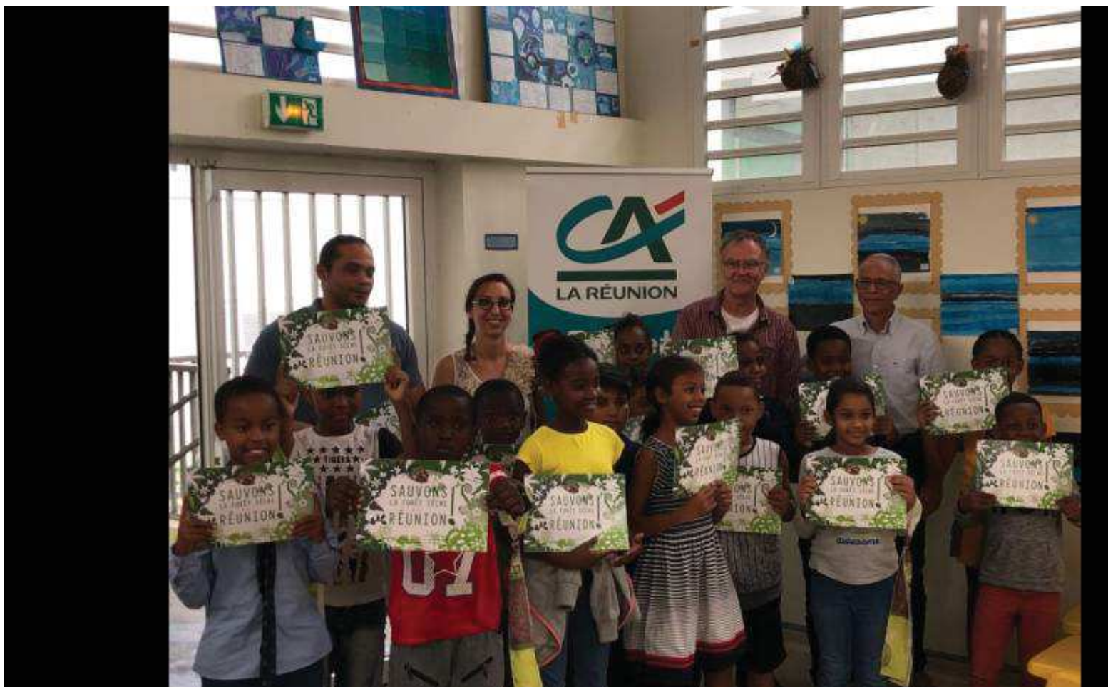
Les écoliers posent fièrement avec un livre retraçant leur aventure.