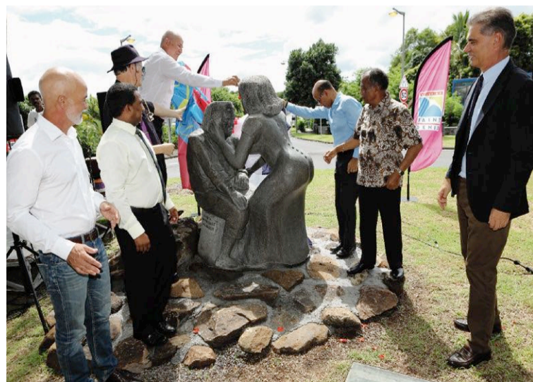
Heva et Enchaing ont désormais leur monument (photo L.L.Y.).